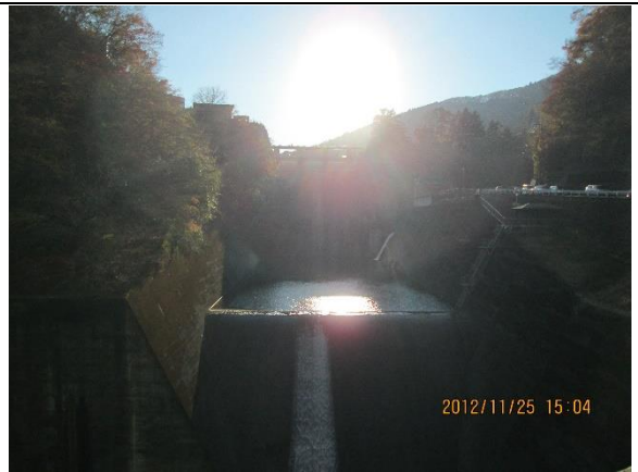
[巡検地 No,2] 小河内ダム …東京水道局が管理する多摩川のダムで重力式コンクリート式ダム。標高は 530mにある。放水路は右側の写真のように青梅街道に沿ってある。