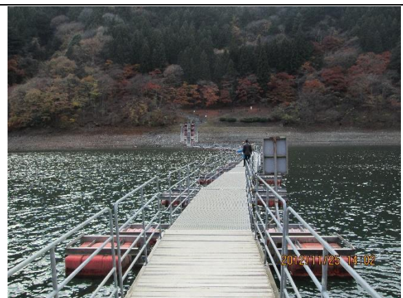
[巡検地 No,3] 浮橋 [ 麦山浮橋 ・留浦浮橋]…左側の写真が奥多摩湖東京よりにある「麦山浮橋」右の写真は奥多摩湖山梨県寄りにある「留浦浮橋」。浮橋は別名「ドラム缶橋」と呼ばれ名の通りドラム缶で浮いている橋。両岸はつながっているものの揺れがある橋。