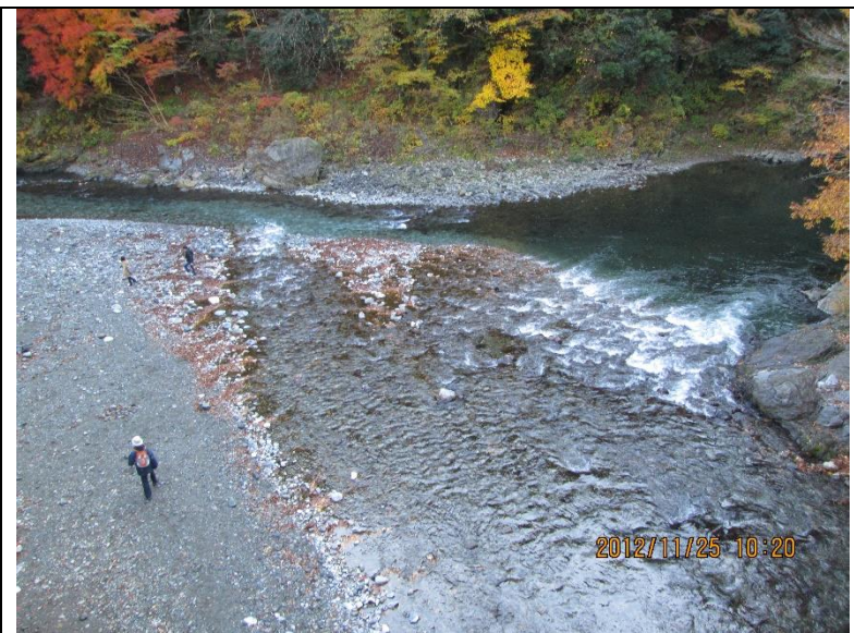
[巡検地 No,1] 日原川合流点[日原川] …日原川が奥多摩駅付近で多摩川に合流する川。上流部には日原鍾乳洞がある。