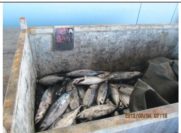
[2 日目巡検地 No,4]焼津市・焼津港…焼津市は静岡市の南側に隣接する漁港で有名な町。東名高速は焼津 IC、東海道本線は焼津駅がある。焼津港はマグロ・カツオ遠洋漁業基地である。鰹節など水産加工業も活発。