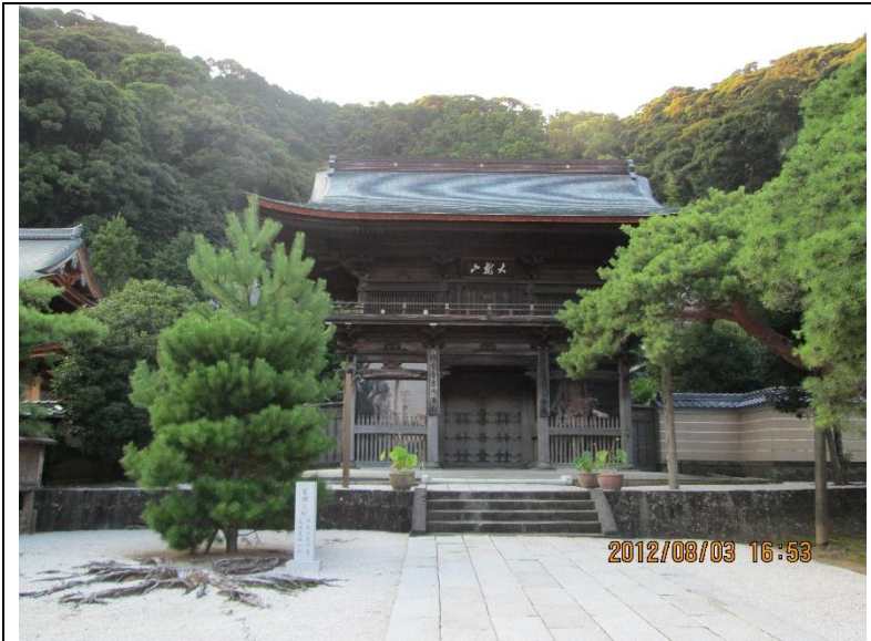
[1 日目巡検地 No,3]臨済寺…「大龍山」という山号の臨済寺は静岡市街北部葵区にある。今川家の菩提寺であり、家康の幼少期に人質として預けられていたことで知られる臨済宗の妙心寺派。