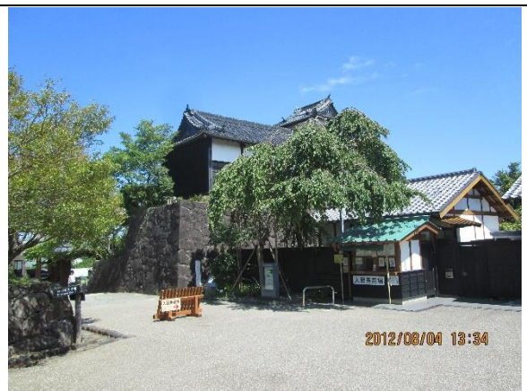
[2 日目巡検地 No,6]掛川城…掛川市は掛川茶でも有名だが、駅北側にある掛川城は今川氏の遠江進出の足掛かりに朝比奈氏に築城させた城。新幹線からも見える。